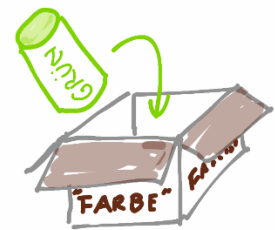
Abb. 5: Observable [Farbe] und der Messwert „Grün“.

Durch das Prinzip der Beobachtung ist klargestellt, dass es eine Beobachterin geben muss. Erst für ihr Bewusstsein spielen die Farben eine Rolle (Handtasche, Schuhe, Autos, Trikots). Das war im Begriff der Variablen noch nicht zu erkennen. Die Observable ist also eine Variable, mit der konkrete Daten erhoben werden. Wir können sie ruhig als die operationale Form einer