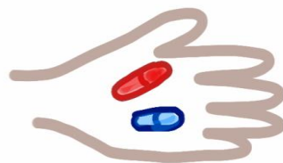
Abb. 2: Die rote oder die blaue Pille? Mensch oder Kreatur?

Wir möchten dem Schöpfer in die Karten schauen. Wir möchten uns nicht nur mit der Relativität Einsteins und der Unschärfe Heisenbergs zufrieden geben – wir wollen zu einem neuen, integralen Weltverständnis gelangen. Wir möchten die ganz große rote Pille, auch wenn uns dadurch sowieso nur die Wahrheit versprochen wurde, und nicht mehr 6 . Lieber werden wir durch die Wahrheit unglücklich, als in dumpfer Verblendung sinnlos grinsend umherzuirren. Wir wollen nicht als konsumneurotische Kleingeister unsere Doppelhaushälfte 7 , die ja schon sinnbildlich für ein halbherziges Leben steht, gegen den Drang unseres vollständigen Selbstes verteidigen. In der Wahrheit über die Welt suchen wir nämlich vor allem auch die Wahrheit über uns selbst und sind dabei bereit, den Preis für diese Suche zu zahlen. So geht es wenigstens den Forscherinnen und Forschern unter uns.