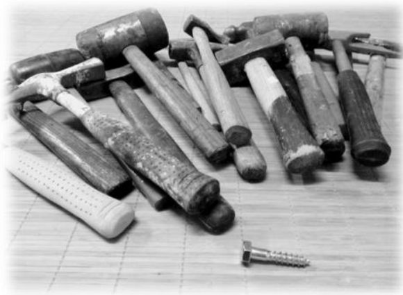
Abb. 4: Eine Werkzeugkiste voller Hämmer und dann eine Schraube! Was nun?

überhaupt eine Angst ohne Ursache, oder ist die nur unbekannt, bzw. diffus? Sowieso entsteht kein Symptom aus nur einer Einwirkung. Es ist die ganze Welt, die wirkt und die sich bis heute so verändert hat, dass bei diesem Patienten genau dieses Problem auftritt. So betrachtet hat ALLES zusammengenommen zu dem Problem geführt. Hätte es im Paradies geregnet, wäre Eva daheim geblieben. Wäre die Schlange Vegetarier gewesen, hätte sie den Apfel selbst gefuttern.