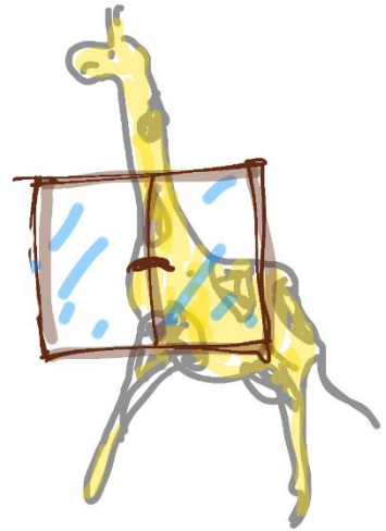
ter. Was man darin sieht, versucht man sich logisch zu erklären.

Wie sehr wir alle auch geblendet und getäuscht sein mögen – das Wasser ist doch nass, oder? Ist der Nebel echt? Ist es Luft, die wir atmen? Nur unter enormen Qualen ist mancher Mensch bereit, sein Weltbild mit all seinen Orientierungspunkten, Sicherungsgurten und Notruftasten hinter sich zu lassen. Konventionen, Traditionen und zwischenmenschliche Spielregeln bilden das solide Gerüst für unsere eigenen Gewohnheiten und Süchte. Wenn wir jetzt all das loslassen, was wir als die Gewissheiten und die Grundsteine des Daseins in uns tragen, dann erleben wir erst einmal nicht das gute Gefühl einer neu erlangten Freiheit, sondern eine große, nagende Ungewissheit. Diese kriecht als existenzielle Unruhe in unsere Zellen und zeigt sich alsbald als Gereiztheit, Stress und Anspannung, was sich bis zur Panik steigern kann. Sobald wir aber den ersten Schritt über die Schwelle der Angst gefunden haben, kann die Ungewissheit zu unserer neuen Heimat werden. Paradoxer Weise kann die Forscherin in ihr sogar zu einem neuen und sehr tiefen Urvertrauen finden, einem neugierigen Urvertrauen ohne Haltegriffe. Dann erst ist sie frei genug – frei genug, um zu suchen und frei genug, um zu finden.